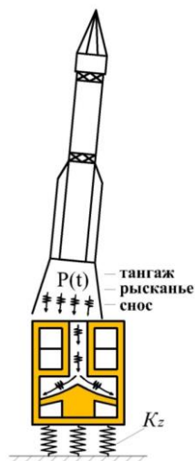
Рис. 1. Специальное сооружение НKK [9]

На указанный ведомственный (для объектов НKK) нормативный документ, пригодный для широкого класса зданий и сооружений различного назначения, академией (ВКА имени А.Ф. Можайского) получены положи-